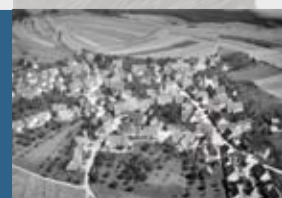
Luftbild von Gruorn im Jahr 1936