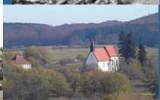
Die ehemalige Kirche und das Schulhaus in Gruorn